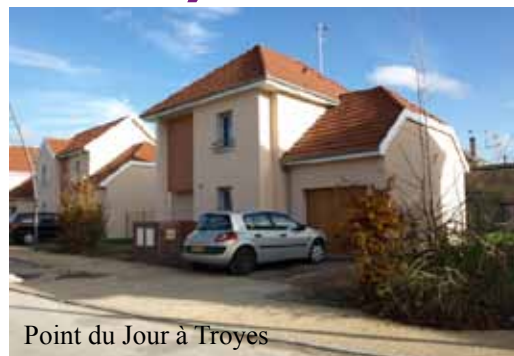
Point du Jour à Troyes

La création de la DDT, en permettant de regrouper les compétences et les métiers, donne au Préfet une capacité d'analyse renforcée et un service technique pluridisciplinaire. L'approche transversale des politiques appliquées aux enjeux des territoires aubois est encore améliorée par l'apport du service environnement de la Préfecture et des compétences en charge des fonctions sociales du logement au sein de la Préfecture et de la Direction Départementale des Affaires Sanitaires et Sociales.